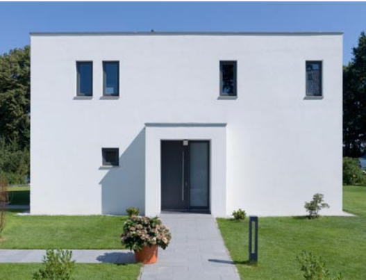
Die natürliche, massive Ziegelbauweise sorgt für gesundes Wohnen und hohe Werthaltigkeit.