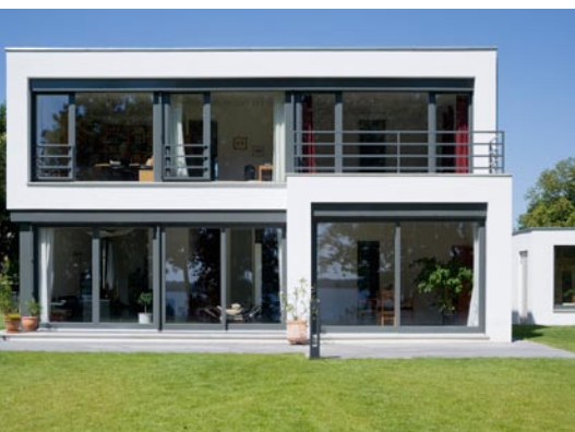
Eine gelungene Komposition: Kubus, Flachdach und große Glasflächen an der Südfront. Die solaren Gewinne unterstützen das energetische Konzept. Hitzeschutz bieten die massiven Ziegelwände. Sie speichern die Wärme und geben sie in den Abendstunden wieder nach außen ab.

Auch das Weiß der Fassade harmoniert mit dem Anthrazitgrau der Fenster. Ästhetik pur. Ein modernes Zitat der Denkansätze von Walter Gropius, das innen wie außen große Sorgfalt in der Entwurfsarbeit erkennen lässt.