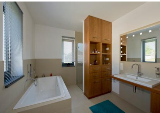
Blick ins Bad – die Einbaumöbel aus Holz sind handgefertigt und betonen in Kombination mit edlem Steinzeug die exklusive Ausstattung.

Mit dem Fokus auf schlichte Eleganz, eine klare Architektursprache und Liebe zum Detail verwirklichten die Bauherren Ihren Lebensraum vom „Casa Mia“ – meinem Zuhause.